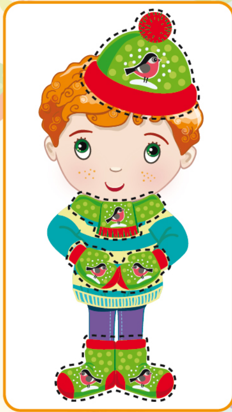
Правильно подобранный комплект одежды! ✅

ВАЖНО! Будьте внимательны, в комплекте должны соблюдаться все три признака на каждом предмете одежды: фон, рисунок и цветовой элемент!