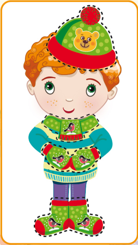
Ошибка в рисунке шапочки ❌