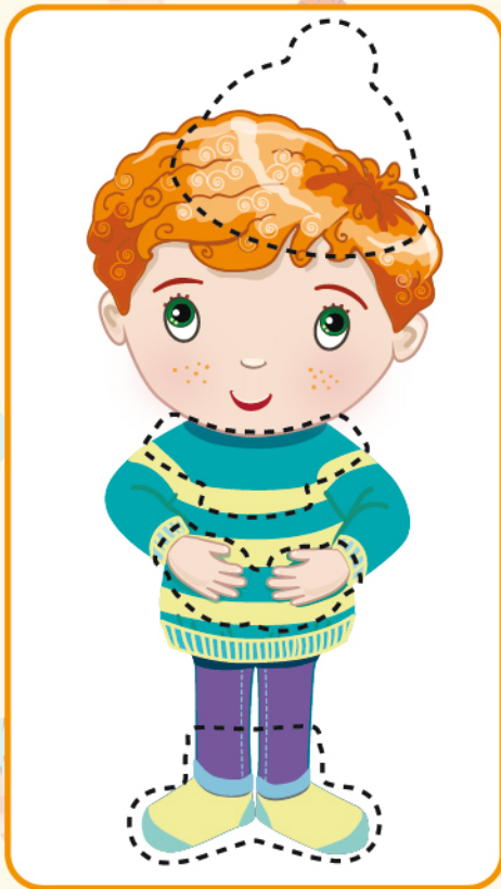
Карточка с персонажем