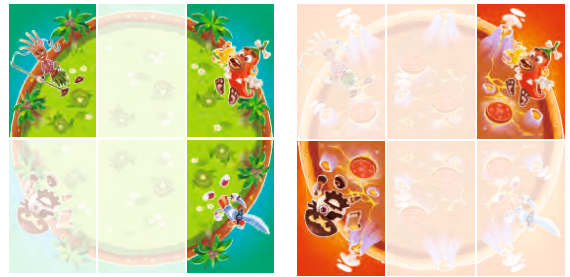
Игрок собирает одновременно 2 пиццы разных цветов и обе пока без центральных кусочков

Ход всегда передается по часовой стрелке следующему игроку. Можно собирать одновременно две пиццы, но разных цветов, при этом в каждой пицце может быть только один цвет. Пока игроку не попалась карта с центром пиццы, будет удобно собирать другие карты в произвольном порядке, как в примере: