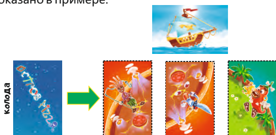
Положить 3 карты

1. Дополнительно к Обычным правилам можно использовать режим игры «Корабль капитана» . Разместите карту «Корабль капитана» рядом с колодой. Перед началом партии возьмите 3 карты из колоды и положите их рядом лицом вверх, как показано в примере: