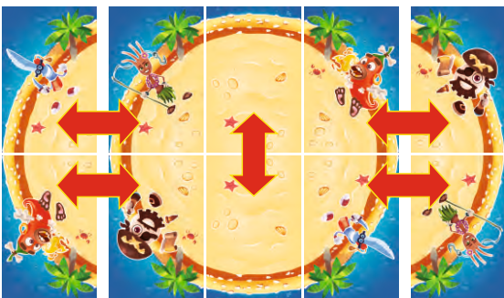
Вид взаимозаменяемых кусочков

Кусочки можно вращать, у каждого кусочка только два места размещения в пицце, как показано в примере: