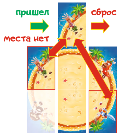
Игроку пришел желтый кусочек, места для которого уже нет, такой кусочек нужно сбросить

Условие повтора. Когда берется кусочек, подходящий по цвету, но разместить его некуда, в первый раз такой кусочек сбрасывается под низ колоды и игрок может продолжить свой ход (дается второй шанс), но если дальше в течение хода игрока условие повторяемости сработает снова, то игрок сбрасывает такой кусочек под низ колоды и передает ход.