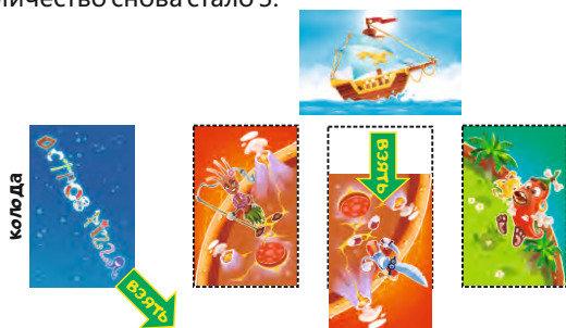
Игрок может брать карты из колоды и/или из «Корабля капитана»

В начале хода каждого игрока положите в «Корабль капитана» столько карт, чтобы их количество снова стало 3.